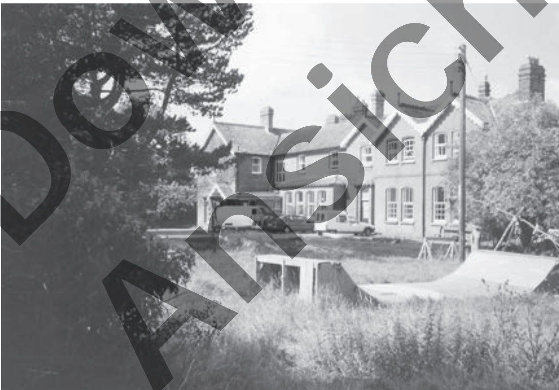
Das Hauptgebäude der Internatsschule Summerhill in Leiston (England)

Summerhill-Schüler haben nach der Schulzeit gelernt, ihre eigenen Wünsche zu verwirklichen – aber nie auf Kosten der Gemeinschaft. Viele von ihnen sind erfolgreich, manche haben sogar säckeweise Geld verdient. Aber alle sagen, dass sie auf die Erfahrungen in Summerhill um nichts in der Welt verzichten möchten.