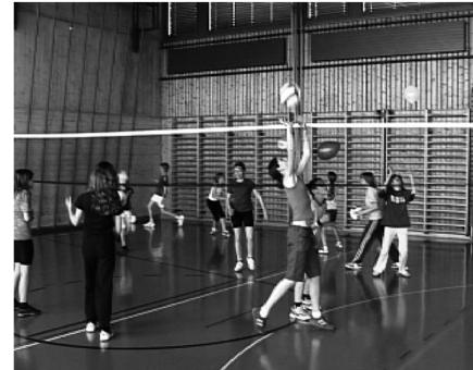
Einlaufen mit verschiedenen Bällen