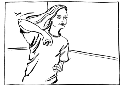
Hauptfehler: Rotieren mit den Armen Korrekturmöglichkeit: Kniehebelauf