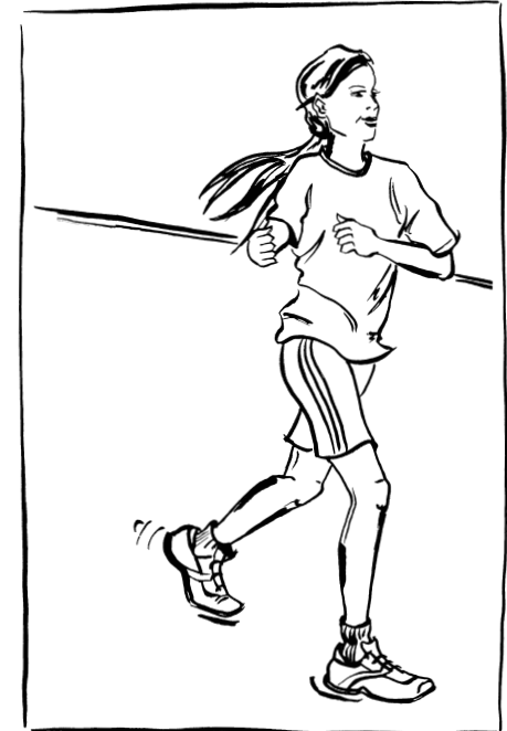
Hauptfehler: Oberkörperrotation Korrekturmöglichkeit: Kniehebelauf