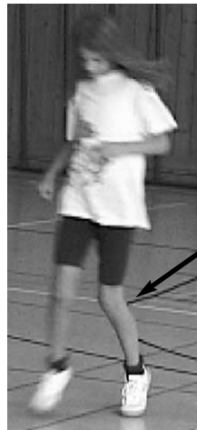
Hauptfehler: Knie geschlossen Korrekturmöglichkeit: Sprunglauf