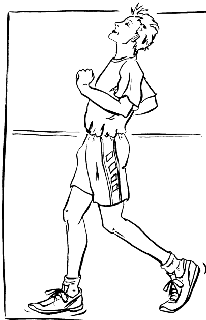
Hauptfehler: Hohlkreuzhaltung, Verkrampfung Korrekturmöglichkeit: Hopsershüpfen, Laufen vw und rw im Wechsel