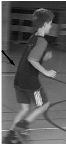
Hauptfehler: Hüfte nicht gestreckt Korrekturmöglichkeit: Sprunglauf

Wenn Fehler festgestellt werden, mit dem betreffenden Schüler oder der Schülerin mitlaufen, auf das Problem aufmerksam machen, sofort eine Korrekturübung vorzeigen und sie anschliessend ausführen lassen.